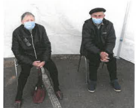
À quoi pense-t-on en attendant ?

L'injection de la deuxième piqûre aura lieu le 11 mai prochain, dans les mêmes conditions.